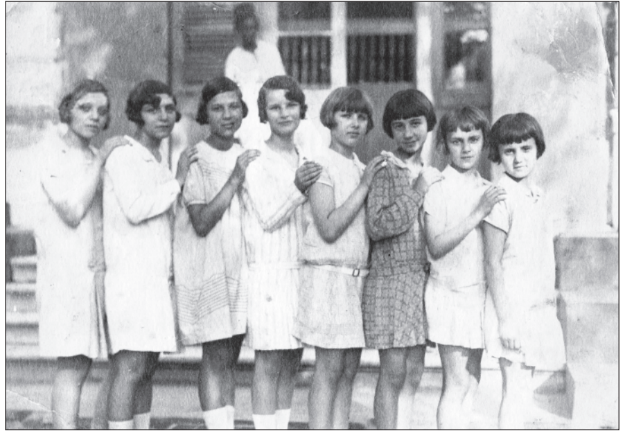
Οι συμμαθήτριες περίπου το 1925

Ο μικρός Σπύρος θα θυμάται αργότερα, ότι στους λόφους πάνω από την παραλία από το χάραμα μέχρι τις οκτώ το πρωί περιπολούσαν έφιπποι αστυνόμοι. Ήταν η ώρα των μπάνιων για τα