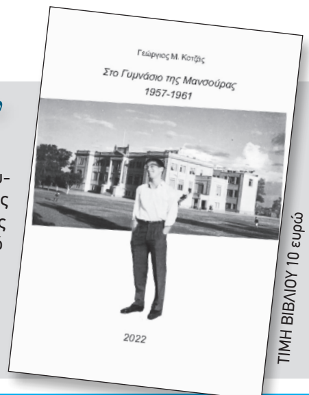
ΤΙΜΗ ΒΙΒΛΙΟΥ 10 ευρώ

Το 1966 αποφοίτησε από το Εθνικό Μετσόβιο Πολυτεχνείο με δίπλωμα Μηχανολόγου-Ηλεκτρολόγου. Το 1967 απέκτησε ΜΕ στην Πυρηνική Τεχνολογία από τη Γαλλία και στη συνέχεια ολοκλήρωσε τις σπουδές του με διπλώματα ΜΕ και D.Eng σε Electric Power Engineering από τις ΗΠΑ το 1970 και 1976 αντίστοιχα.