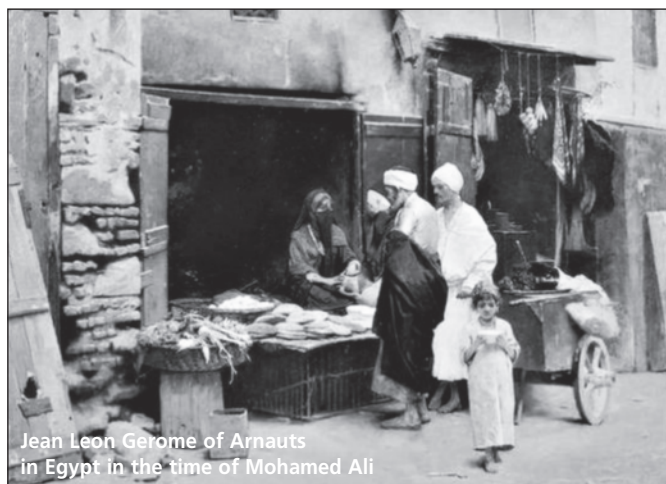
Jean Leon Gerome of Arnauts in Egypt in the time of Mohamed Ali

«και παίνεις στον μονάρχην Αρταξέρξη που ευνοϊκά σε βάζει στην αυλή του, και σε προσφέρει σατραπείες και τέτοια. Και συ τα δέχεσαι με απελπισία αυτά τα πράγματα που δεν τα θέλεις. Άλλα ζητεί η ψυχή σου, γι' άλλα κλαίει τον έπαινο του Δήμου και των Σοφιστών, τα δύσκολα και τ' ανεκτίμητα Εύγε: την Αγορά, το θέατρο, και τους Στεφάνους. Αυτά πού θα στα δώσει ο Αρταξέρξης, αυτά πού θα τα βρεις στη σατραπεία και τι ζωή χωρίς αυτά θα κάμεις;».