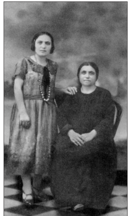
Μανσούρα 1924. «Με τα μάτια στραμμένα στη Μικρασία».

Φωτογραφίες από το βιβλίο της Ολυμπίας Καράγιωργα «Αίγυπτος, Μανσούρα και η εκεί Ελληνική ζωή μας» σελ. 406, 408, 410, 443